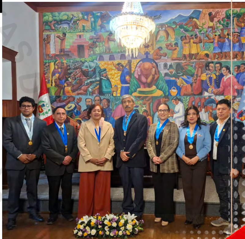
Directivos del periodo 2026-2027

Sin embargo, es importante hacer conocer que hubo un error en la redacción del acta correspondiente, consignando el periodo de gestión 2026-2028, por lo que se ha iniciado el trámite ante Registros Públicos para rectificar este pequeño error, pues debió decir periodo 2026-2027.