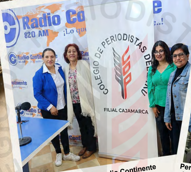
Programa radial en radio Continente por el Día de la Mujer.