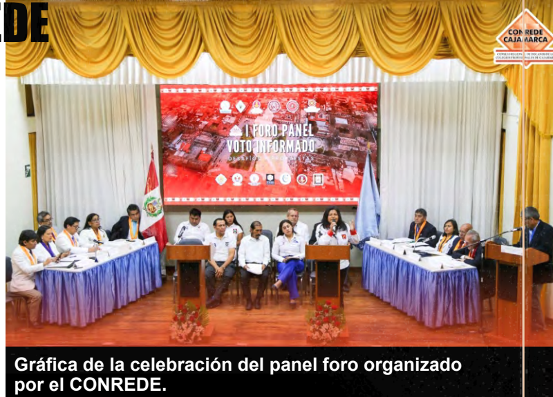
Gráfica de la celebración del panel foro organizado por el CONREDE.

El pasado 24 de marzo se desarrolló un panel foro en el local del Colegio Médico para presentar la agenda regional a los candidatos a senadores y diputados de esta región. El decano de nuestra Orden tuvo el honor de asumir el cargo de moderador del evento.