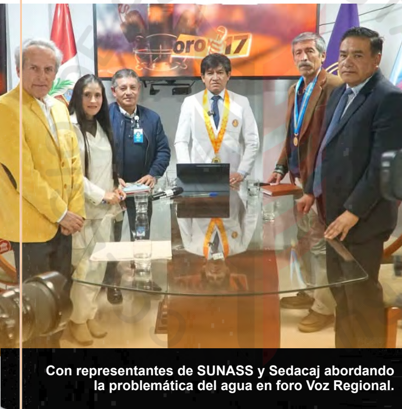
Con representantes de SUNASS y Sedacaj abordando la problemática del agua en foro Voz Regional.

Nuestra participación constituye un aporte para hacer visibles los problemas de la población y exigir soluciones a las autoridades de la región.