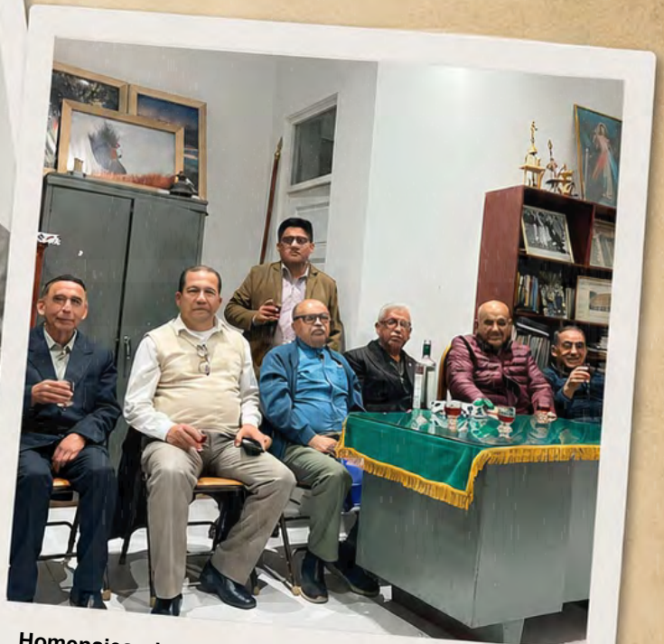
Homenajeando a los padres periodistas en su Día.