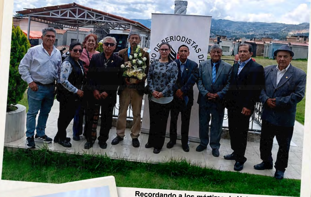
Recordando a los mártires de Uchuraccay. Romería al cementerio de Cajamarca.