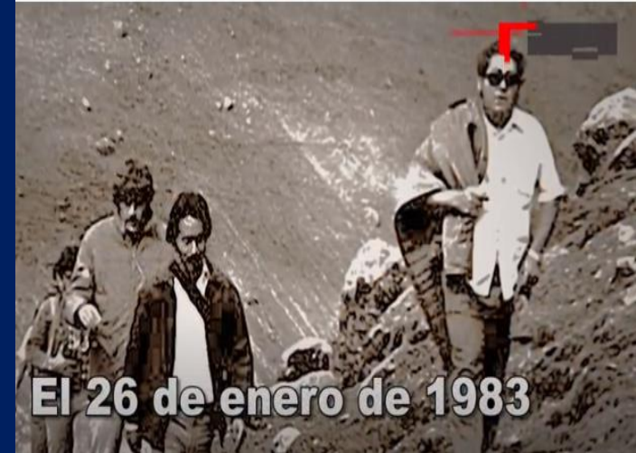
Subiendo a Uchurucay