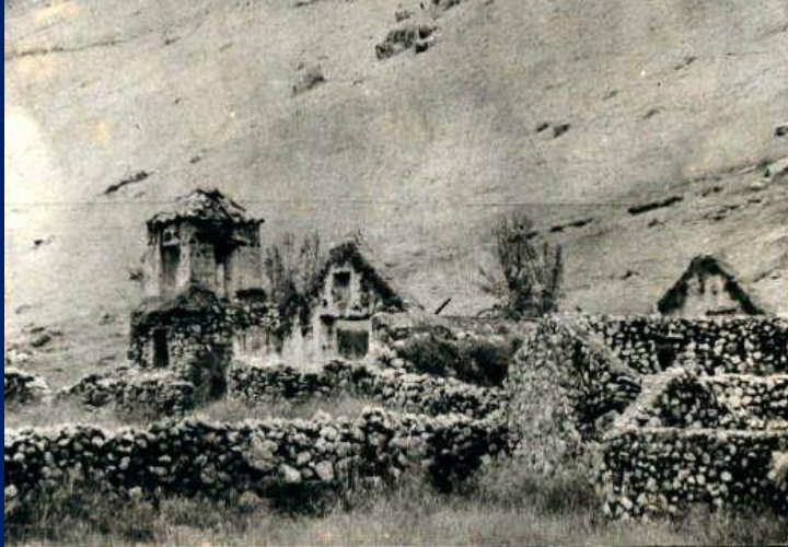
Vista del pueblo de Uchuracay