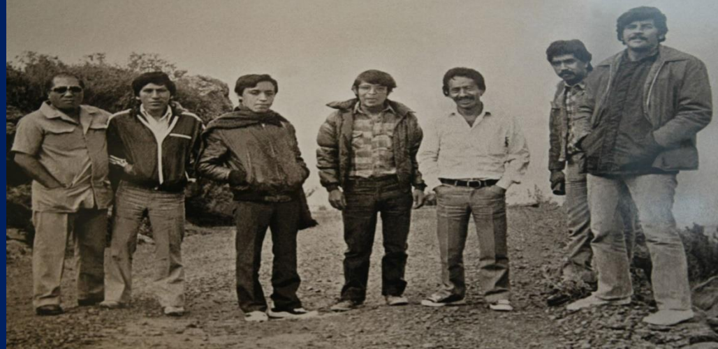
Último retrato de los periodistas mártires