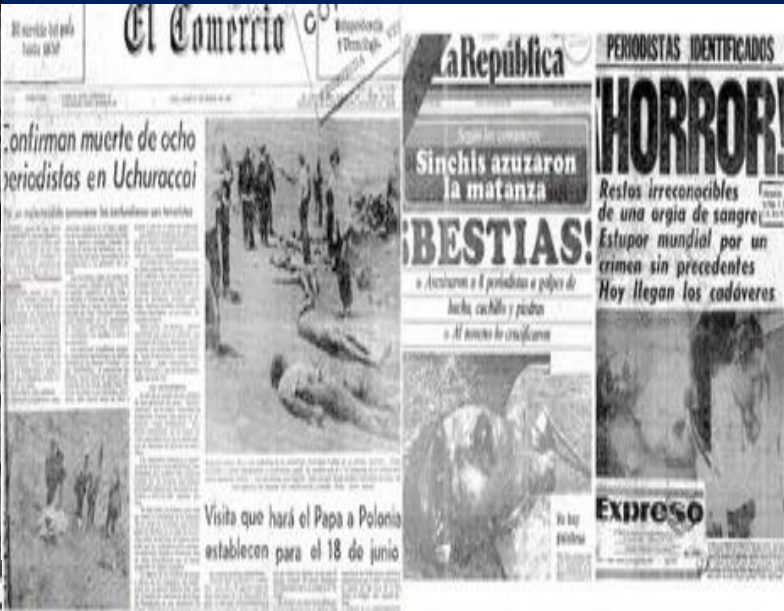
Illustration 4.5 – Unes d'El Comercio (gauche), de La República (centre) et d'Expreso (droite) du 31 janvier